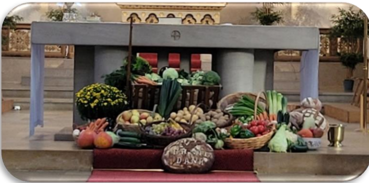
Kirche Herz-Jesu

Allen Helferinnen und Helfern, sowie Spenderinnen und Spendern ein herzliches Dankeschön.