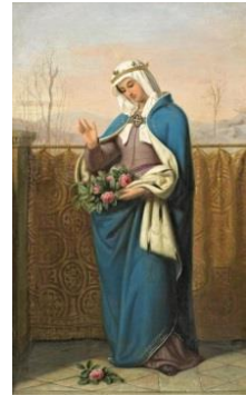
Heilige Elisabeth von Thüringen

Die Pfarr-Caritas St. Eligius freut sich auf Ihr Kommen!