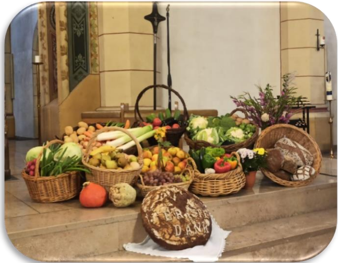
Pfarrkirche St. Eligius/ Foto: Marina Rzehak